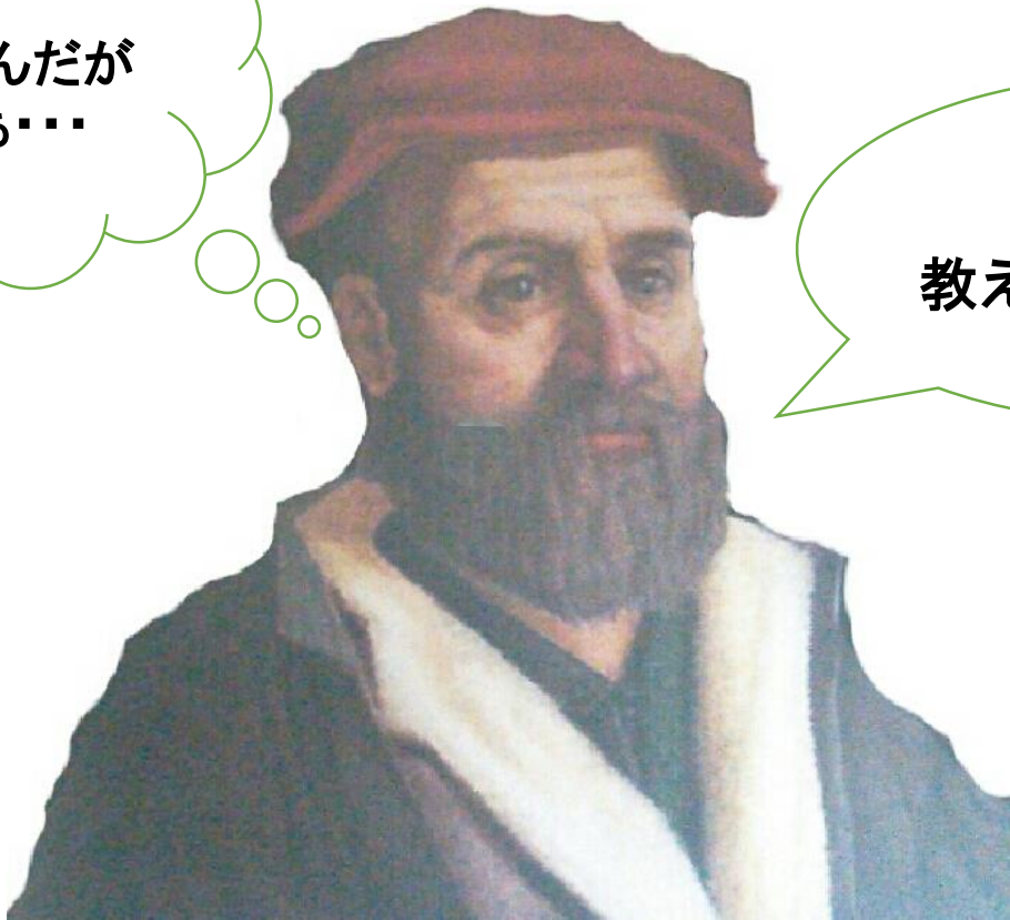
ニコロ・フォンタナ・タルタリア