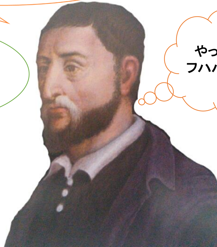
ジェロラモ・カルダーノ